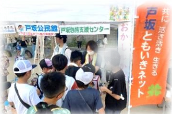
↑ お菓子つかみに大行列！

今回のお祭りで“ためまっぷ”のイメージキャラクター“へさまろ”が、戸坂の愛されキャラとして地域へデビュー！屋台もたくさんあり！トリの「マツケンサンバ」を全員が踊り最高潮の盛り上がり！全世代、笑顔いっぱいの楽しい夜でした！