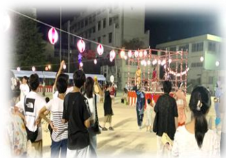
↑ マツケンサンバの踊りの輪！