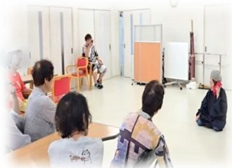
↑ サギ師がおばあちゃんを騙そうとしているシーン

今後も多くの方に特殊詐欺について知ってもらい、「自分も騙されるかも」と危機感を持って詐欺を防ぎましょう！